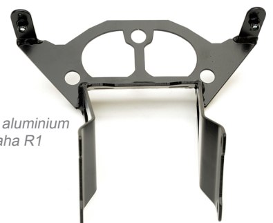
Araignée aluminium Yamaha R1

Araignées et boucles arrière disponibles pour les modèles suivants :