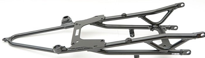
Boucle arrière aluminium Yamaha R1