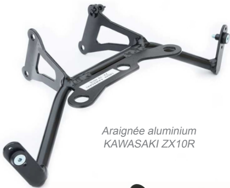
Araignée aluminium KAWASAKI ZX10R

En aluminium Reprend les points d'origine Plug and play pour usage racing Liste et informations sur www.evo-xracing.com