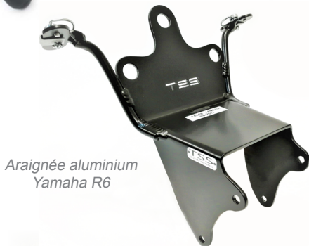
Araignée aluminium Yamaha R6