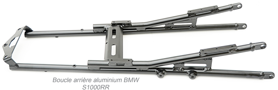
Boucle arrière aluminium BMW S1000RR