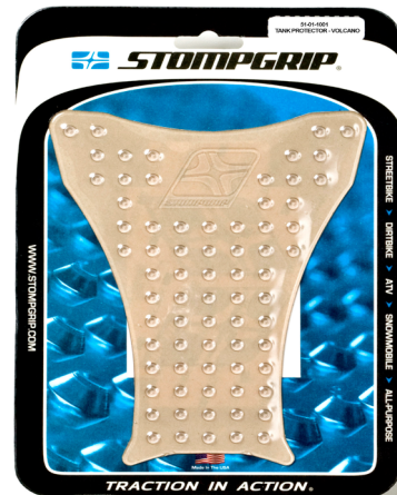
Protection de réservoir