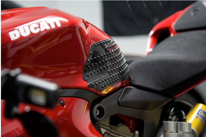
Grips de réservoir Stomp Grip, adhésif 3M, existent en noir ou transparent pour chaque application.

Des modèles universels sont également disponibles.