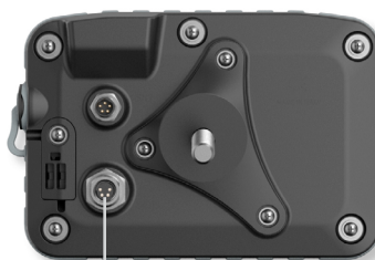
Connexions NTC et capteurs

Chronomètre autonome GPS 50Hz Pistes pré enregistrées Led multifonctions (2 alarmes + 5 Leds régime maxi) Alarmes et shiftlight (régime) WIFI intégré (transmission des données) Ecran LCD 240x128 px