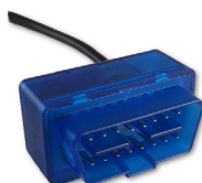
Interface OBD pour GT3000, GT400 et LT2000, connexion directe à la prise diag de votre voiture dernière génération.,