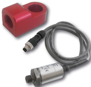
Capteur de pression freinage, huile...