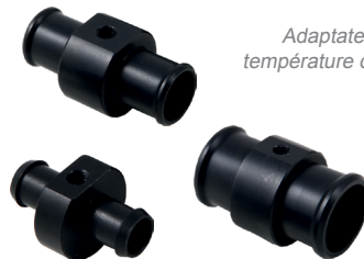
Adaptateurs pour sonde de température d'eau, 12 17 ou 25mm.