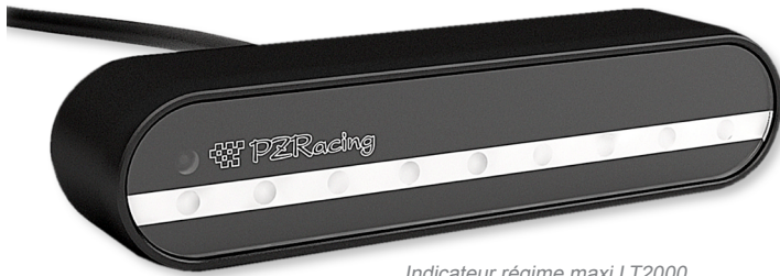
Indicateur régime maxi LT2000