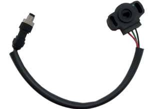
Capteur potentiométrique pour relevé rotation papillon (ouverture gaz).