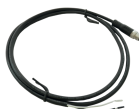
Câble pour RPM, vitesse, tps ou rapport engagé en provenance de l'ECU (une information au choix)