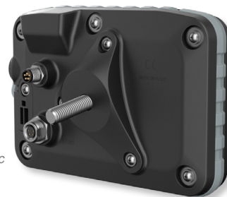
2 modes de fixation arrière, boîtier avec gomme antivibrations intégrée