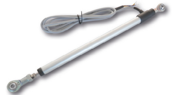
Capteur de déplacement linéaire pour enfonceur fourche / amortisseur, débattement 75 ou 150mm