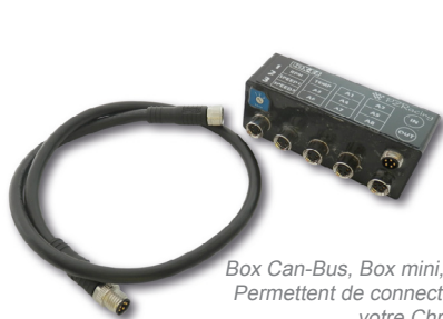
Box Can-Bus, Box mini, Box expande BOX-E4 Permettent de connecter plusieurs capteurs à votre Chrono GPS

Retrouvez la liste complète des capteurs et applications sur www.evo-xracing.com .