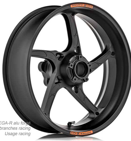
PIEGA-R alu forgé 5 branches racing Usage racing