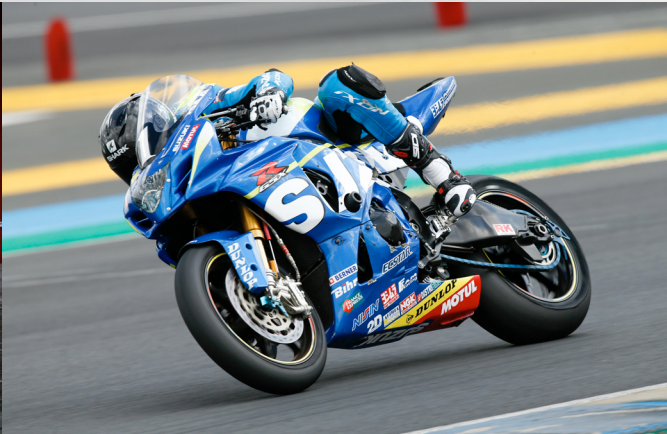
Le team SERT, multiple champion du monde d'endurance