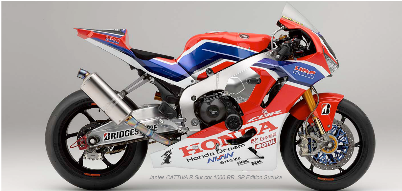
Jantes CATTIVA R Sur cbr 1000 RR SP Edition Suzuki

Notes: OPTION Couleur non standard, rajouter 200 € HT par jante - délai 2 semaines de plus que les couleurs standard X Couleur standard N.A. Non disponible ORANGE REPSOL Option à 200€ HT par jante