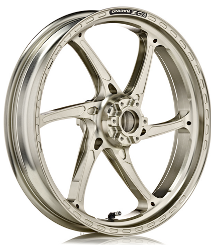
GASS RSA GASS RSA R