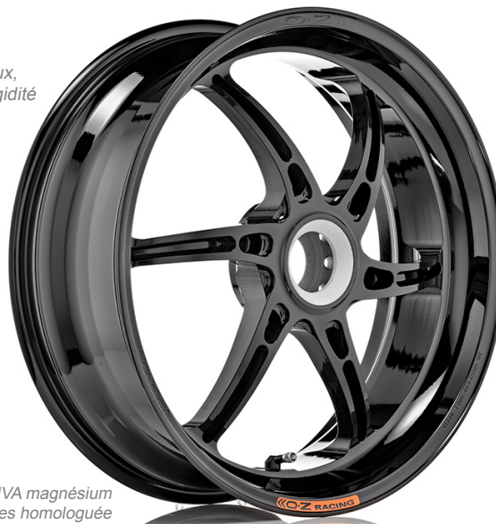
CATTIVA magnésium 6 branches homologuée Usage route / racing

— Allègements latéraux, gain de poids et de rigidité