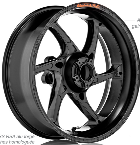
GASS RSA alu forgé 6 branches homologuée Usage route / racing

Roulements, entretoises, absorbeurs de couple, porte couronne, valve 90° inclus avec toutes les jantes OZ.