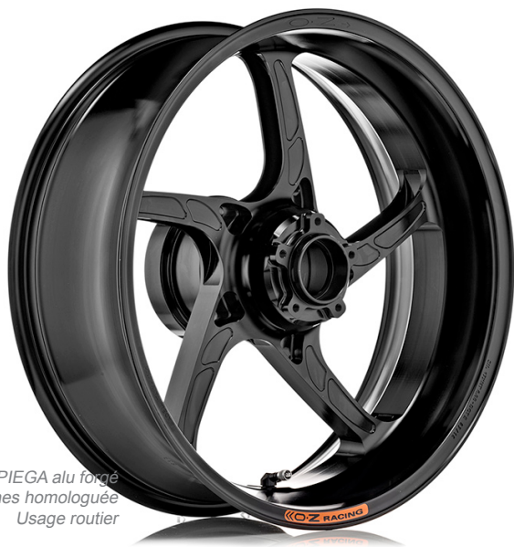
PIEGA alu forgé 5 branches homologuée Usage routier

La gamme OZ MOTORBIKE est composée de 5 types de jantes, et deux matériaux différents : l'aluminium forgé pour les modèles PIEGA, PIEGA R, GASS RSA, et GASS RSA R, et le magnésium pour le modèle CATTIVA. Les jantes existent en 5 ou 6 branches : 5 branches pour la PIEGA et la PIEGA R, 6 branches pour la GASS RSA et la CATTIVA. Les jantes sont livrées prêtes à monter : seule la couronne est spécifique, contactez nous pour la commander.