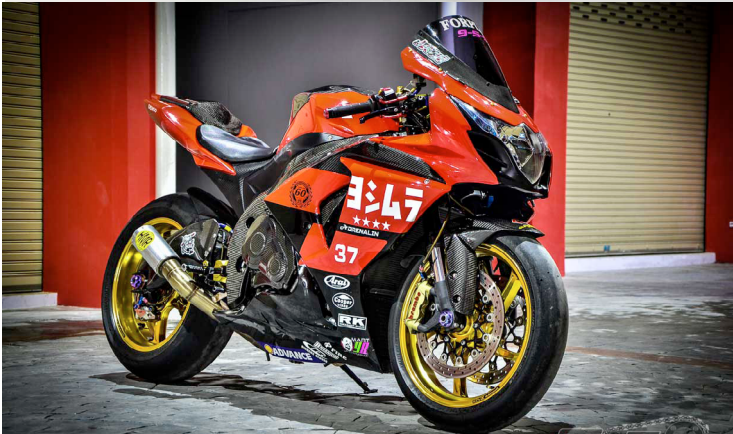
GSXR Supersport by HALL MR