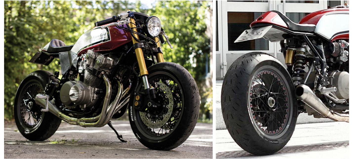
Honda CB1100 - Custom