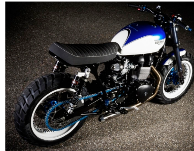
Shore break, Triumph Provenge