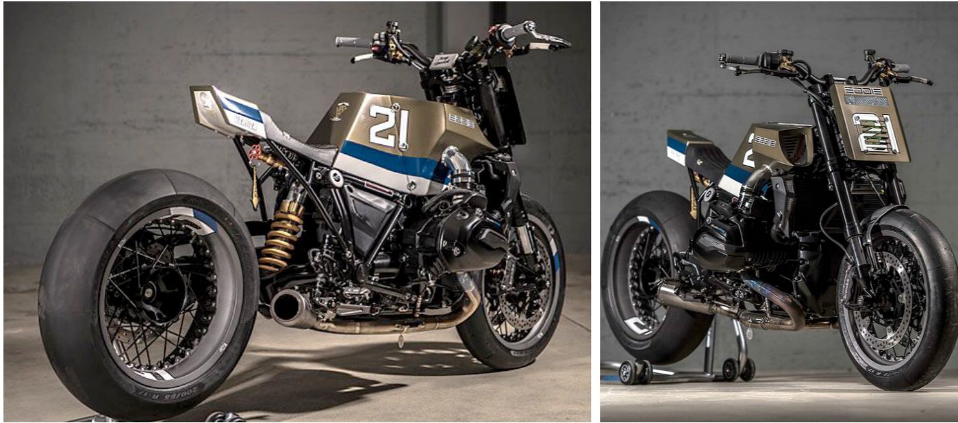
BMW Nine T Eddie 21 - VTR Customs