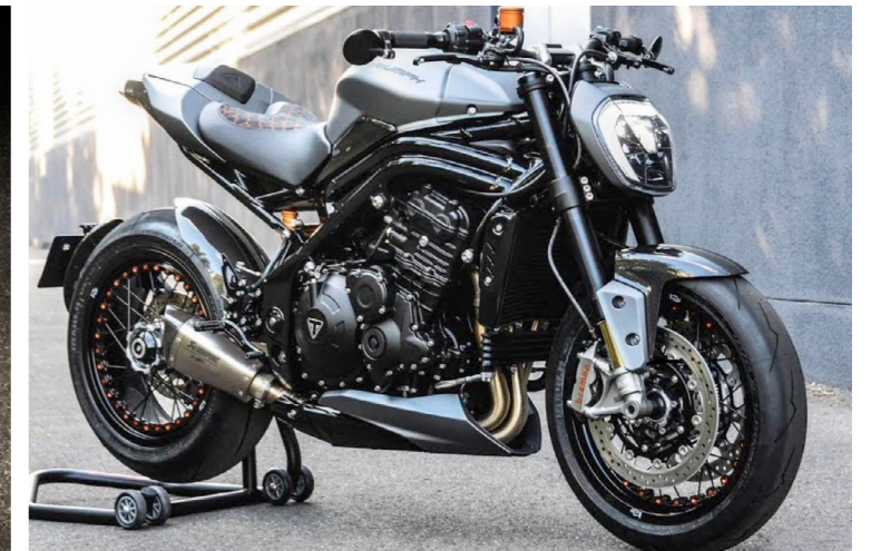
Street triple Jubilee, Triumph GB94