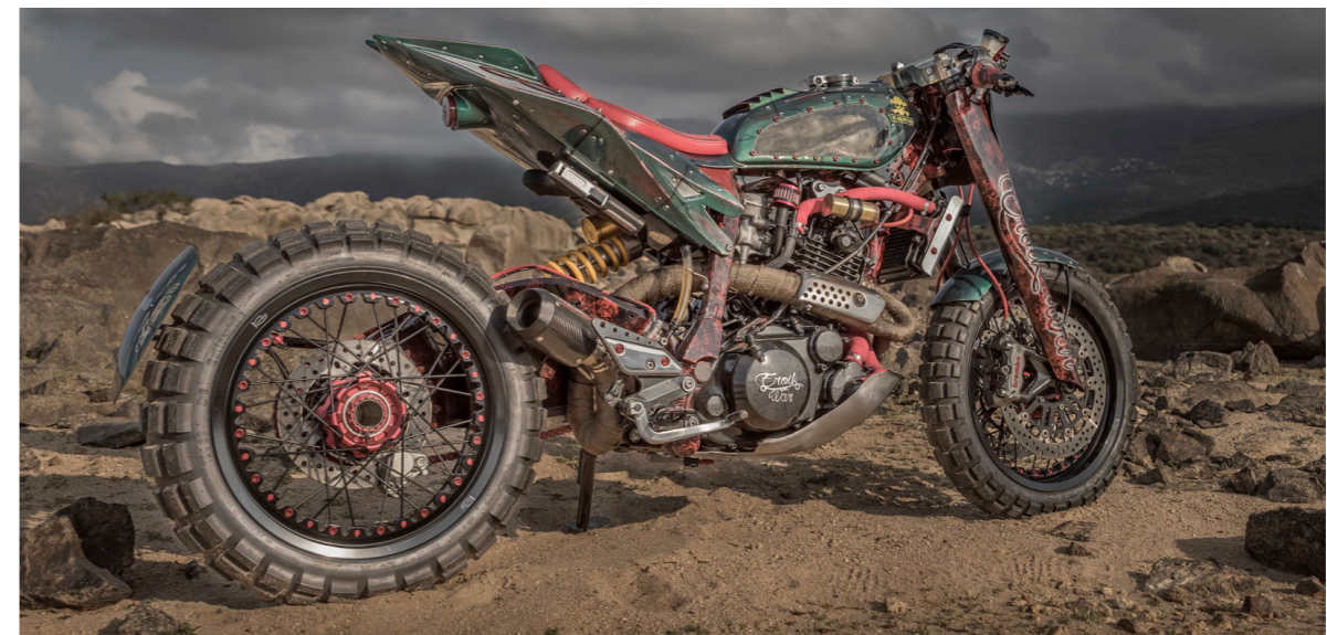
Eroik War XTZ 660 Keke Design Corse

APRILIA, MV AGUSTA ET NORTON SONT AUSSI DES MARQUES DE MOTO SUR LESQUELLES LES JANTES KIN20 SONT DISPONIBLES.