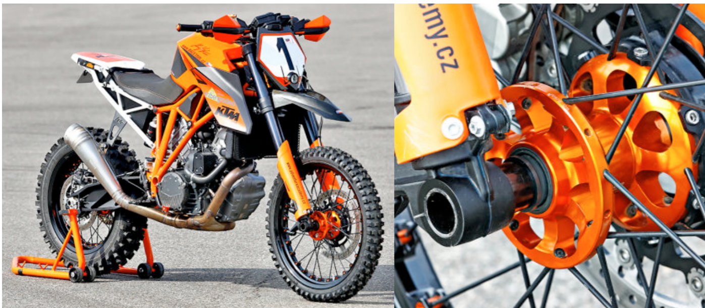
KTM 1290 Super Adventure / Super duke - Heinik