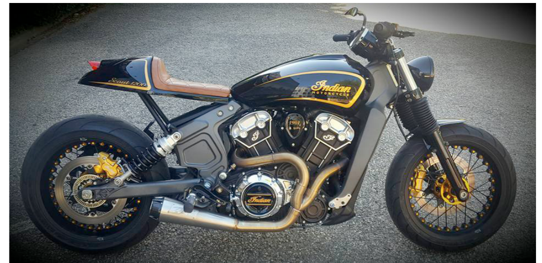
Indian Scout - Indian Lyon David