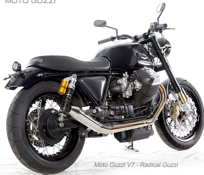
Moto Guzzi V7 - Radical Guzzi