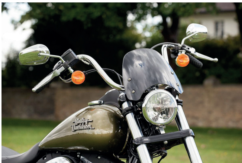
Saute vent Dart Classic S3 HD Street Bob