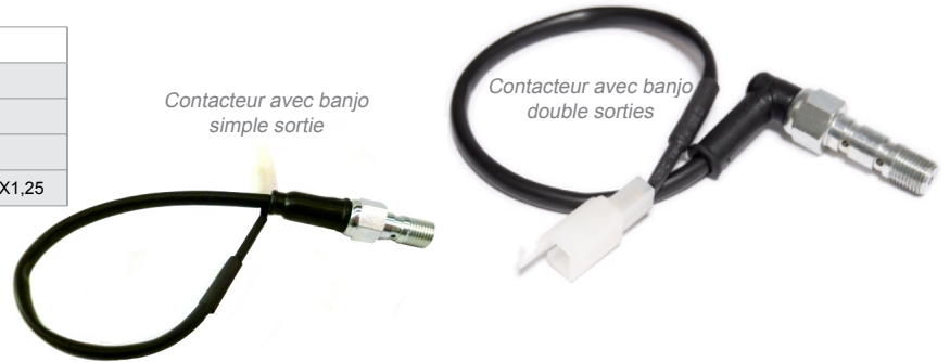
Contacteur avec banjo simple sortie