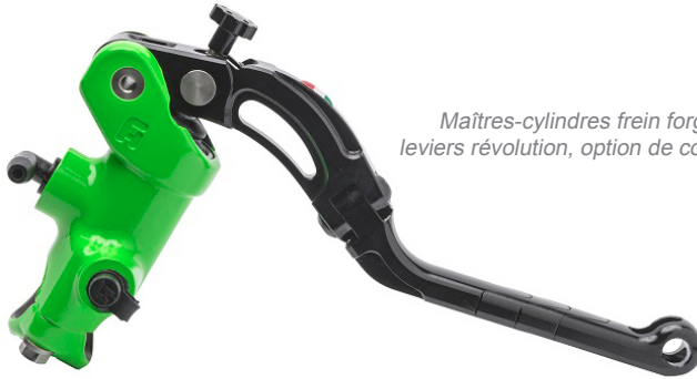
Maîtres-cylindres frein forgé leviers révolution, option de couleur.