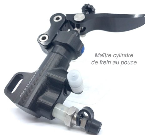
Maître cylindre de frein au pouce