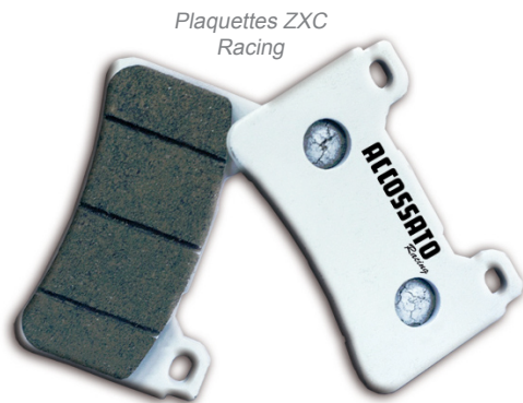
Plaquettes ZXC Racing