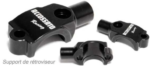
Support de rétroviseur