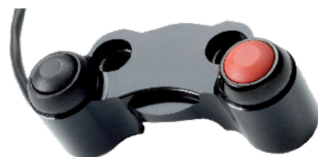
PS001 se fixe directement sur les maîtres cylindres Accossato ou Brembo. Entraxe de 30 à 32 mm.