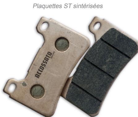
Plaquettes ST sintérisées