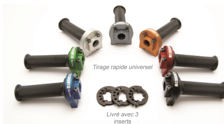
Tirage rapide universel

Pensez à commander également les câbles (voir ci-dessous), nous préciser le modèle exact et l'année de la moto lors de la commande