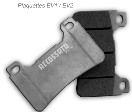
Plaquettes EV1 / EV2

Plaquettes de frein disponibles pour les modèles suivants :