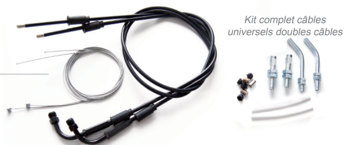
Kit complet câbles universels doubles câbles