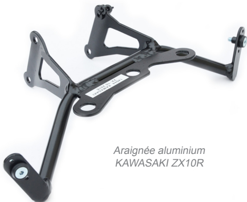
Araignée aluminium KAWASAKI ZX10R