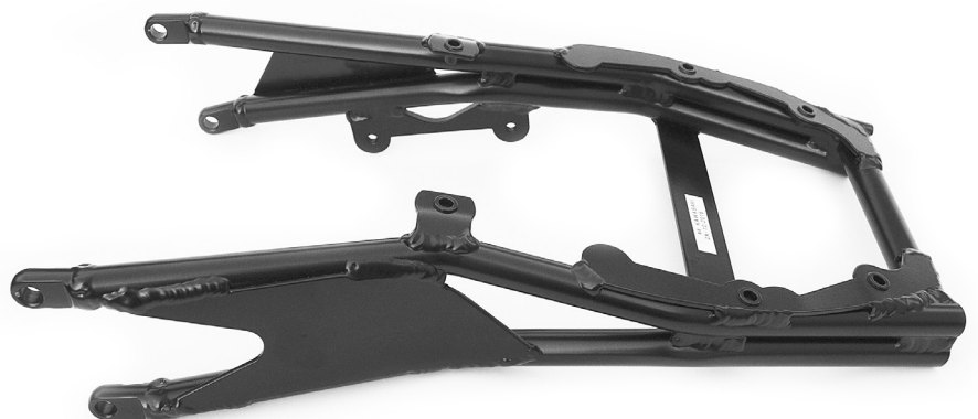
Boucle arrière aluminium KAWASAKI ZX10R