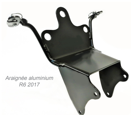
Araignée aluminium R6 2017

Ces éléments sont plus légers, plus résistants et réparables que les éléments d'origine. Ces boucles arrières et araignées RACING HOLDERS sont utilisées par de nombreux teams et permettent de remonter les compteurs d'origine, carénages et autres éléments destinés à la compétition. Ils ne sont pas prévus pour remonter phares et autres éléments non indispensables pour un usage sur piste.